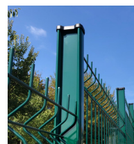
Poteau H alu 155