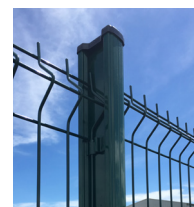
Poteau H alu 250