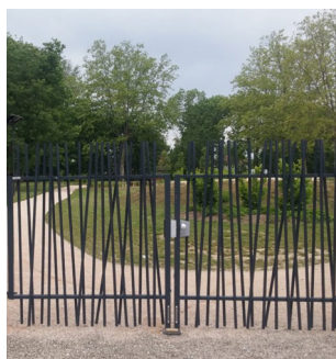
PORTAIL DOUBLE VANTAUX