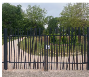
PORTAIL DOUBLE VANTAUX