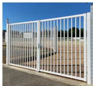
PORTAIL DOUBLE VANTAUX