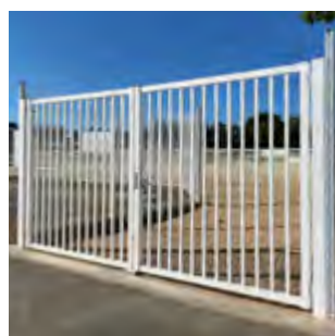
PORTAIL DOUBLE VANTAUX